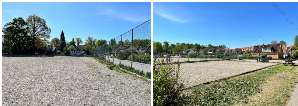
Figur 2. Fotografier från platsen.

Under våren år 2025 genomfördes en medborgardialog (se bilaga 1) i syfte att undersöka hur platsen används idag samt vilka funktioner och aktiviteter medborgarna önskar i framtiden. Majoriteten av de inkomna synpunkterna var positiva, och medborgarna ser positivt på förslaget med en ny lekplats i Jakobslund.