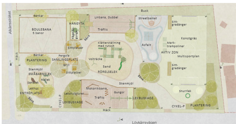
Figur 3. Illustrationsplan som visar programförslaget för den nya lekplatsen.

Förvaltningen föreslår att även den del av Lövkärsvägen som ligger i direkt anslutning till lekparken inkluderas i projektet och byggs om i samband med anläggningen. Detta möjliggör en säkrare miljö för oskyddade trafikanter, tydligare entrézoner till parken samt ett positivt möte mellan park och gata. Denna del kommer att studeras närmare i den fortsatta planeringen.